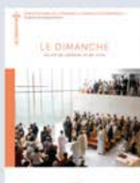
Le dimanche Un art de célébrer et de vivre