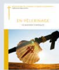
En pèlerinage. Le quotidien transfiguré