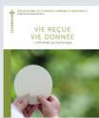
Vie reçue, vie donnée. L'offrande eucharistique