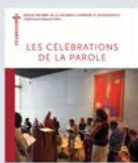
Les célébrations de la parole