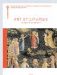
Art et liturgie. La grâce d'une alliance