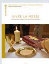
Vivre la messe. La nouvelle traduction du Missel romain