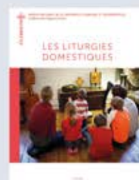
Les liturgies domestiques